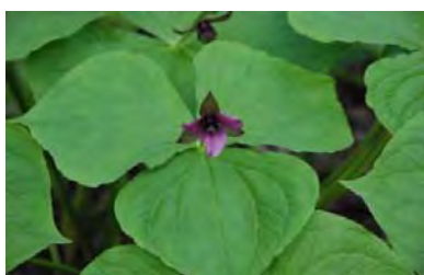
コジマエンレイソウ