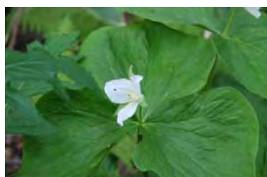
オオバナエンレイソウ